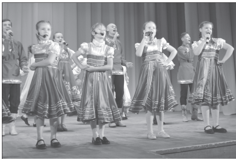
«Веселинка» развеселила всех

Придя на обычное, казалось бы, родительское собрание, мы, мамы учеников 2 «А» школы №1, попали на праздник в честь Дня матери.