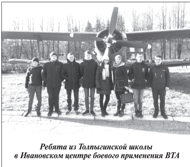
Ребята из Толпыгинской школы в Ивановском центре боевого применения ВТА