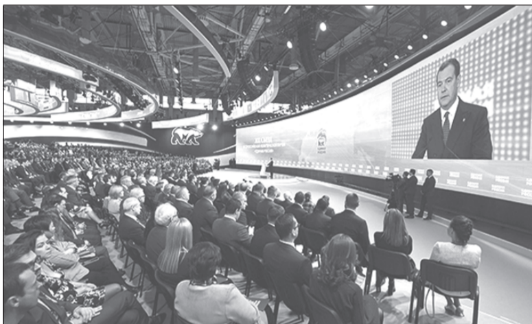
На съезде дан старт подготовке к выборам в Гос.Думу

В Москве завершил свою работу XIX Съезд партии «Единая Россия», на котором выступил Президент России Владимир Путин. В работе Съезда приняли участие Председатель Партии, премьер-министр Дмитрий Медведев, высшее руководство Партии, члены Правительства, делегаты со всей страны, губернаторы, депутаты Государственной Думы, члены Совета Федерации, общественники и журналисты.