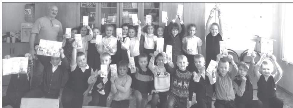
Ребята получили ответы на многие «почему?»