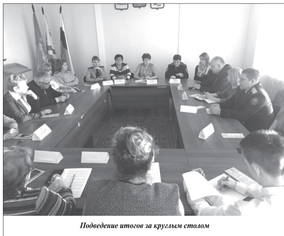
Подведение итогов за круглым столом

лет такие изменения производятся только на основании решения органа опеки и попечительства.