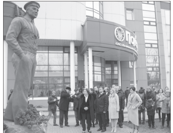
У завода «Полёт» в Иванове открыт памятник создателю ранцевого парашюта Глебу Котельникову.

Валентина Терешкова вместе со Станиславом Воскресенским также побывала в цехах завода «Полет», они пообщались с работниками на их рабочих местах, ответили на вопросы.