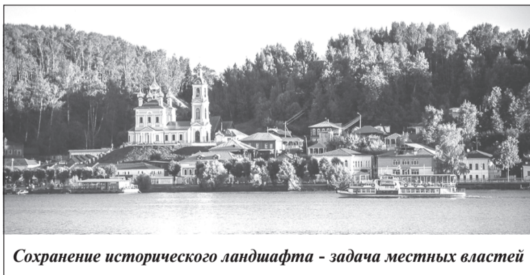
Сохранение исторического ландшафта - задача местных властей

В своём выступлении он уделил особое внимание теме сохранения культурного наследия и, в частности, утверждённым в начале 2019 года требованиям к градостроительным регламентам в границах Плещёского городского поселения и за его пределами - уникальному межрегиональному проекту, направленному на сохранение ландшафтов, исторических панорам и традиционного архитектурного облика города.