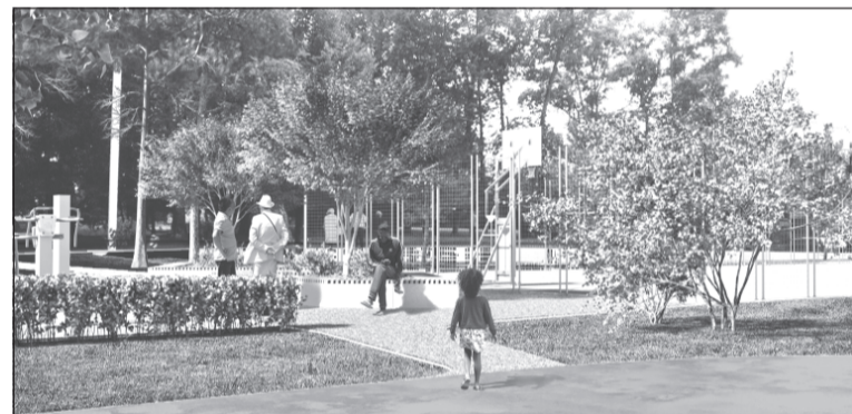
Так красиво в скором времени будет выглядеть территория бывшей станции юных техников

3. С дизайн-проектом благоустройства общественной территории по ул.Революционная между д.119 и д.125 можно ознакомиться в управлении жилищно-коммунального хозяйства района администрации Приволжского муниципального района по адресу: г.Приволжск, ул.Революционная, д.63, кабинет 26 и на официальном сайте Приволжского муниципального района в сети «Интернет».