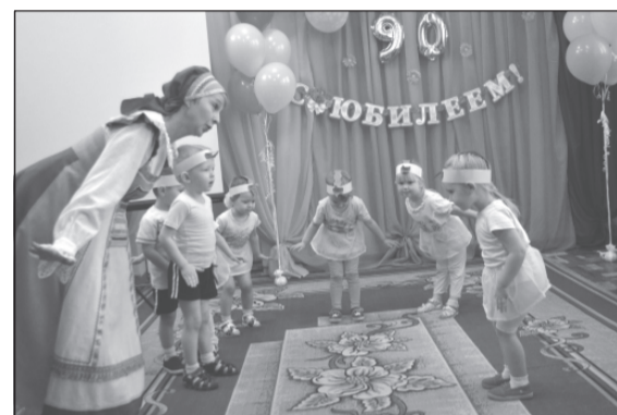
«Цыплятки». Дебют младшей группы